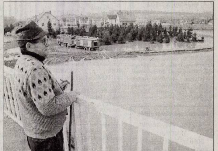
A Bódva Szendrőnél okozta a legnagyobb gondot.